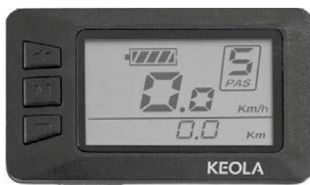
Afb. 4: Display