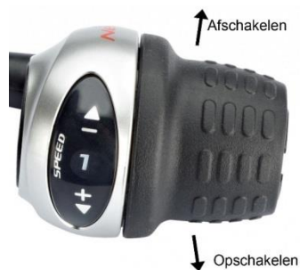
Afb. 2: Versnelling

Uw fiets is uitgerust met een accu die de motor en het besturingssysteem van energie voorziet. De fiets geeft elektrische ondersteuning zodra u de trappers laat draaien.