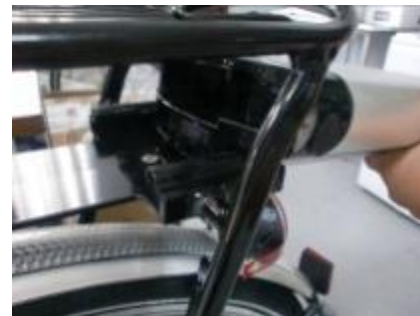
Schuif de accu terug in de fiets