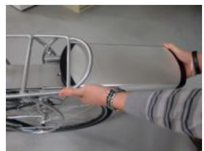
Gebruik hierbij twee handen