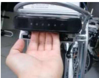
Trek de accu naar achteren uit de bagagedrager