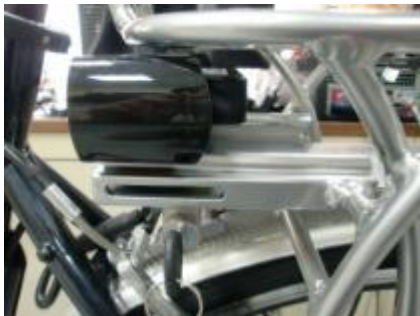
Draai de sleutel tegen de klok in