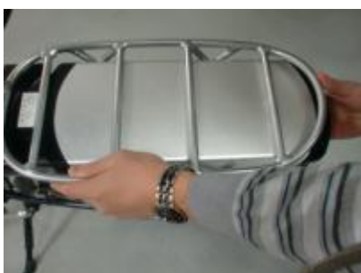
Druk de accu goed aan in de controller