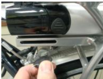
Draai de sleutel met de klok mee en haal de sleutel uit het slot