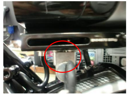
Kijk of je de borgpin niet ziet