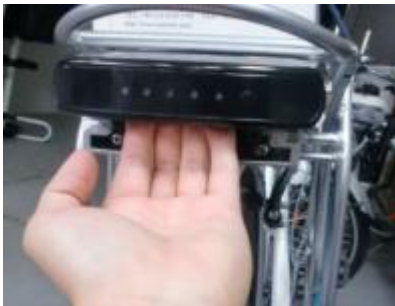
Trek de accu naar achteren uit de bagagedrager