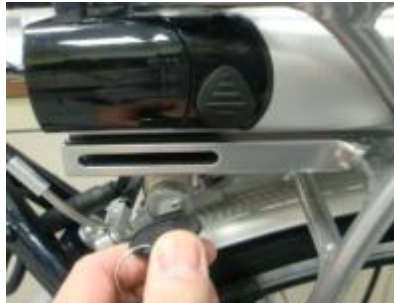
Draai de sleutel met de klok mee en haal de sleutel uit het slot