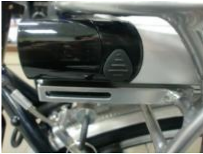
Zorg dat de rubberdop in de accu zit