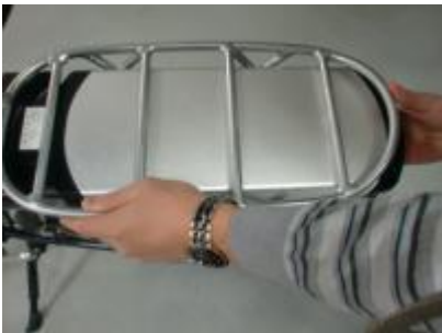
Druk de accu goed aan in de controller