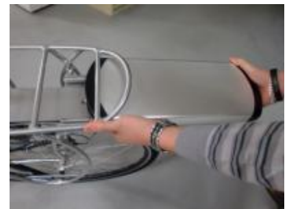
Gebruik hierbij twee handen