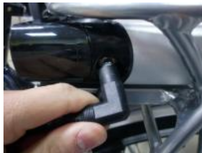
Steek de connector van de acculader in de accu