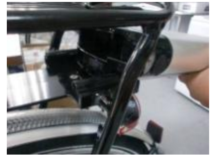
Schuif de accu terug in de fiets