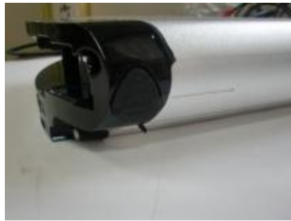
Zorg dat de rubberdop dicht is