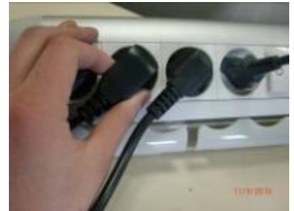
Steek de stekker in het stopcontact (230Vac-16A)