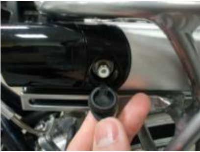
Haal de rubberdop voorzichtig van de accu