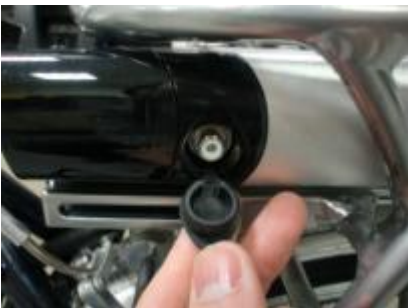
Haal de rubberdop voorzichtig uit de accu