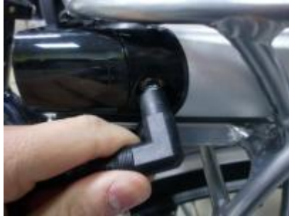
Steek de connector van de acculader in de accu