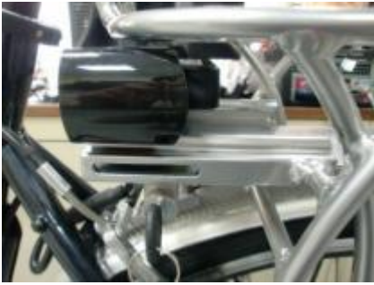
Draai de sleutel tegen de klok in