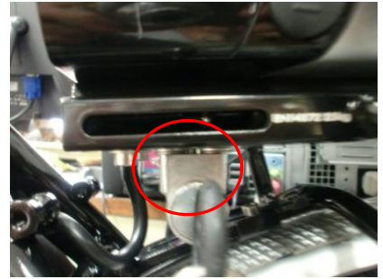
Kijk of je de borgpin niet ziet