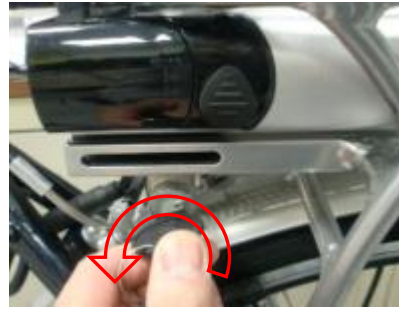
Draai de sleutel tegen de klok in