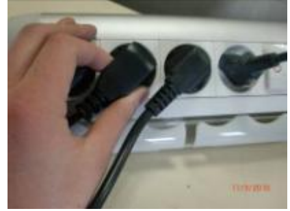
Steek de stekker in het stopcontact (230Vac-16A)