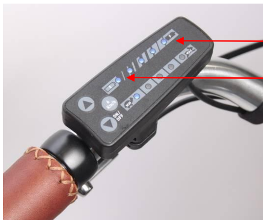
Accu-indicator Diagnose LED