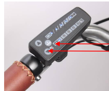
Knop ON / OFF Knop Loopondersteuning

Met de knop ON / OFF schakelt u de ondersteuning aan of uit. (Uitschakelen door de knop 3 sec. vast te houden.)