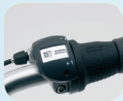
8 Shimano Nexus versnellingen