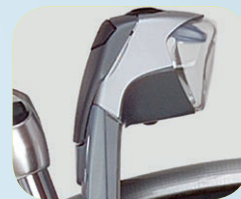
Power Eye-LED verlichting geïntegreerd in de voorvork