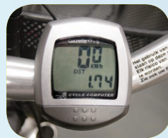
Digitale fietscomputer met 5 functies