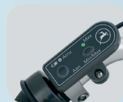
Bedieningsdisplay accu op stuur