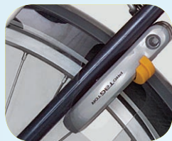
Eén sleutel voor zowel fietsslot als accubeuizing