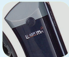
Panasonic Lithium-ion accu