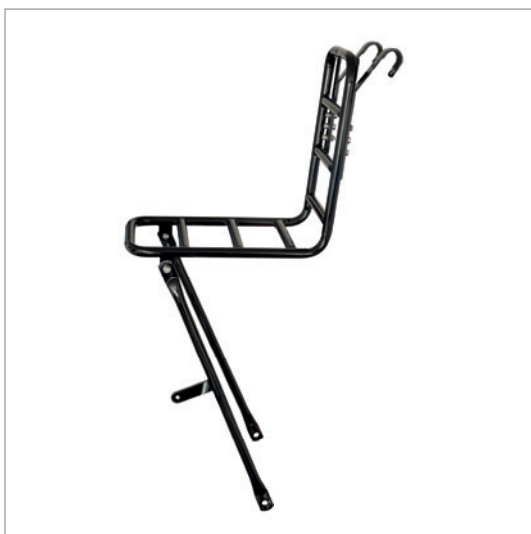
Voordrager slim, transport